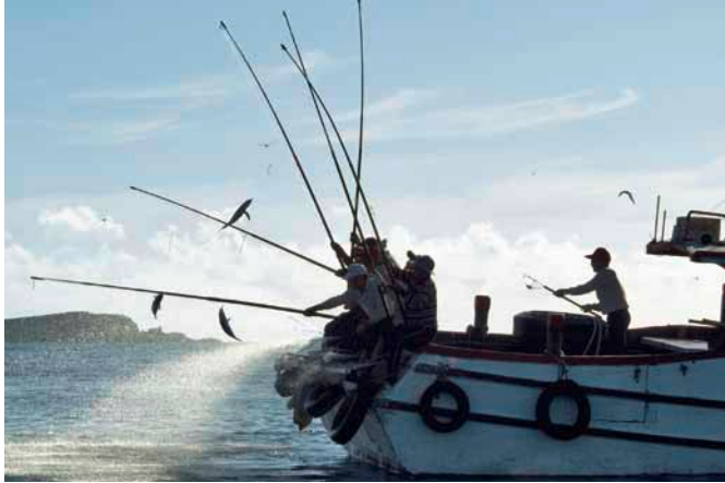
Mit Ruten und Leinen gefangener Fisch – eine nachhaltige Alternative