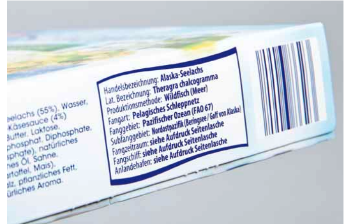
Beispiel für die vollständige Kennzeichnung eines Fischproduktes

Nachhaltigkeit und Transparenz sind dabei gefragt, ebenso eine vollständige Kennzeichnung der Produkte. Nur so kann an Regal oder Fischtheke die richtige Wahl getroffen werden. Folgende Angaben müssen zur Vollständigkeit vorhanden sein: